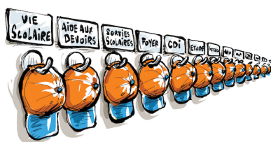
LE VESTIAIRE DE L'AED

Nos collègues AED étaient en grève le jeudi 2 décembre pour dénoncer la précarité et des conditions de travail abusives... Notre organisation soutient leur mouvement et refuse la stratégie du Ministre qui consiste à opposer enseignants et AED.