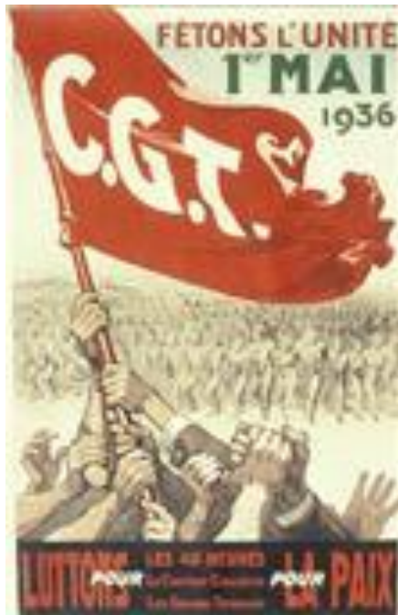
Affiche de 1936